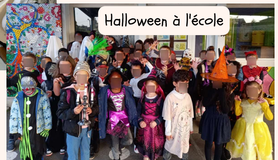
Halloween à l'école